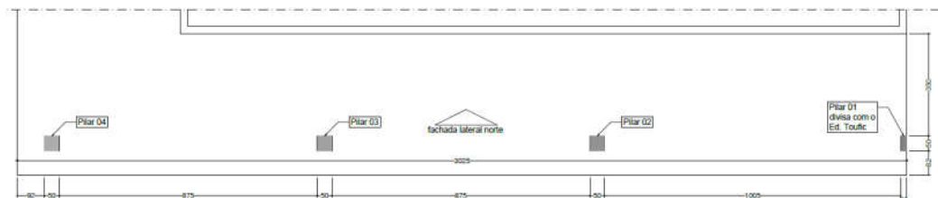
Figura 1 - Planta Baixa